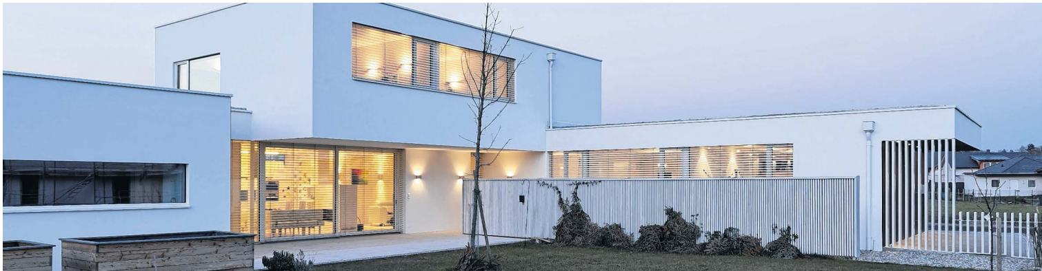
Hell und freundlich präsentiert sich der Holz-Massivbau der Familie Wenighofer, außen weiß verputzt, innen Holz in Sichtqualität, weiß lasiert. Fotos: Poppe*Prehal Architekten, Walter Ebenhofer