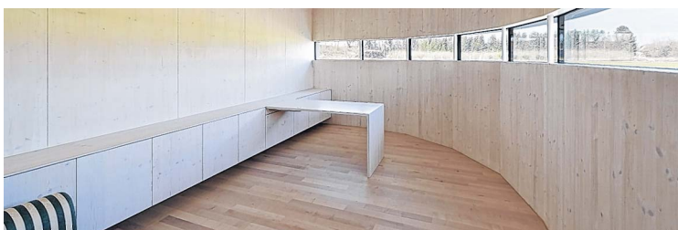
Für das Wohlbefinden der Patienten sorgt die harmonisch, ruhige Atmosphäre im Wartezimmer sowie in den beiden Behandlungsräumen des Ordinationstraktes.